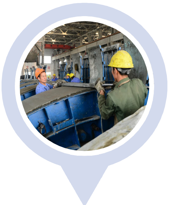
杭构·建工建材公司管片项目部 杭州市城投系统“两保一优”立新功劳动竞赛先进集体