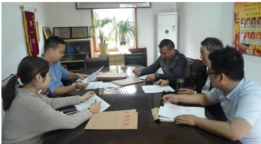
杭构·砼二分公司经营科 杭州市城投系统“两保一优”立新功劳动竞赛先进集体