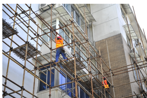
图 2、图 3、图 4:“九莲新村”社区立面整治