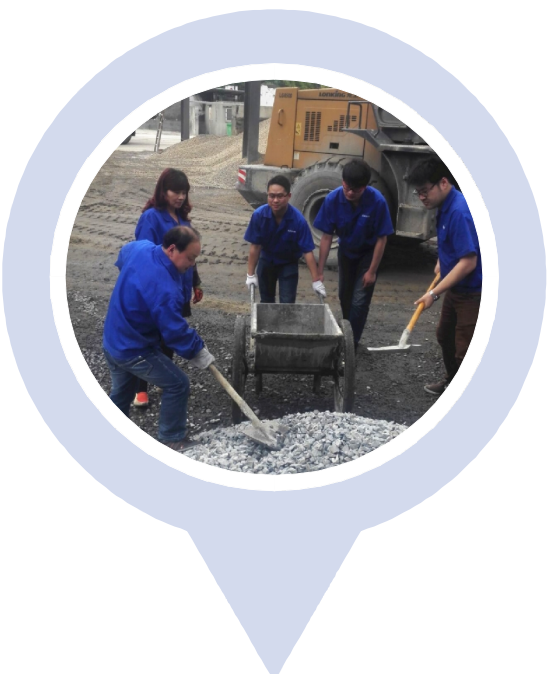
杭构·砼二分公司技术科 “杭州市工人先锋号”