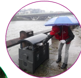
集团“心铸”志愿者队伍的成员，一边撑伞，一边拾捡沿途垃圾。