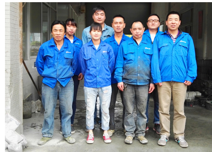
杭构·建工建材公司技术部“杭州市青年文明号”