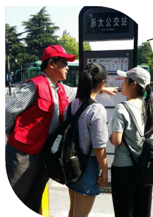
“五、一”节志愿者们放弃难得的假期，为出行游客指路。