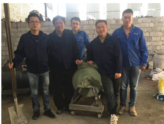
杭构·外加剂厂(技术科)杭州市建设系统“工人先锋号”