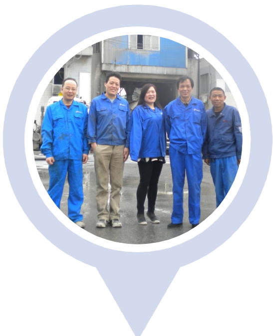
杭构·建工砼公司搅拌班 省建设建材系统“安康杯”竞赛活动优胜班组