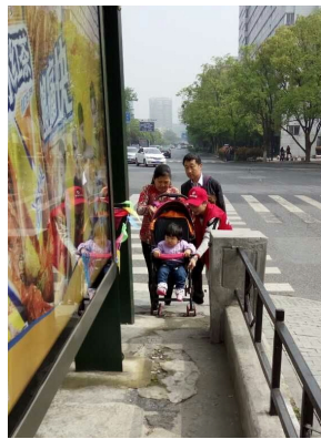
帮助手推婴儿车乘客上车。