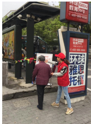
搀扶老弱病残乘客候车。