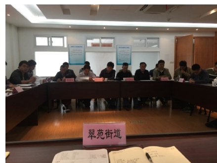
图 1:“文三路城市道路整治”专题会议现场