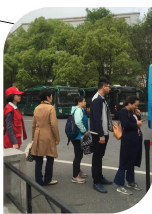
引导乘客文明排队候车。

劳动创造价值 劳动创造智慧 劳动创造未来 劳动创造美好生活…… 让我们一起快乐劳动！ ——献给五一国际劳动节