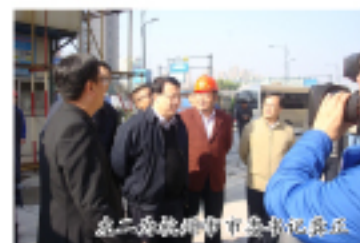
集团近江单元拆迁安置房项目

11月20日上午,杭州市委书记龚正一行莅临集团承建的近江单元拆迁安置房项目进行了视察调研。查看了工程的实体建设情况。