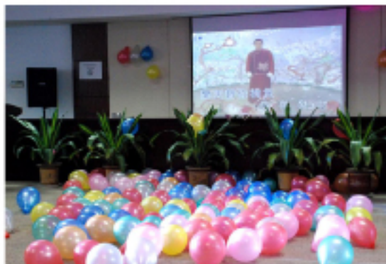
▲比赛现场堆满了彩色气球,一片节日的气氛。