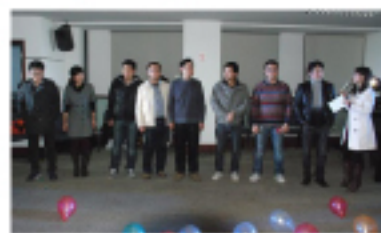
▲比赛的十佳选手纷纷表达了自己的感受,并为女员工们送上了节日的祝福。