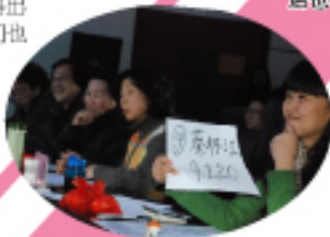
▲评委们在认真的为选手打分。